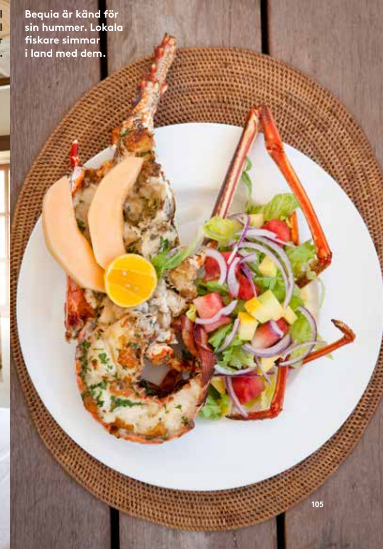
Bequia är känd för sin hummer. Lokala fiskare simmar i land med dem.