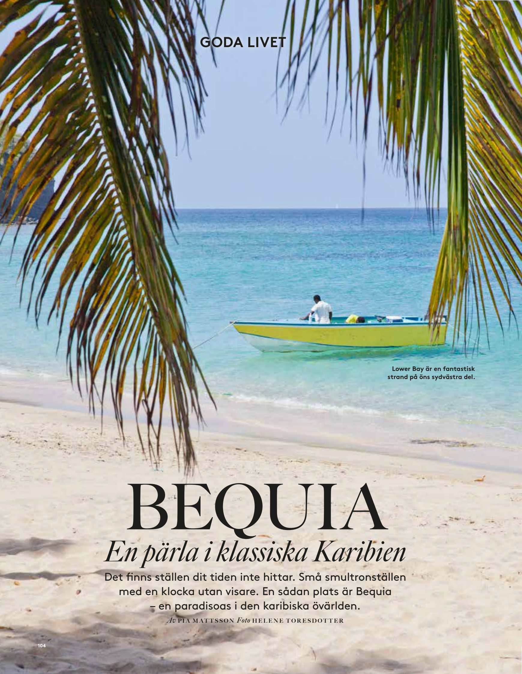
Lower Bay är en fantastisk strand på öns sydvästra del.