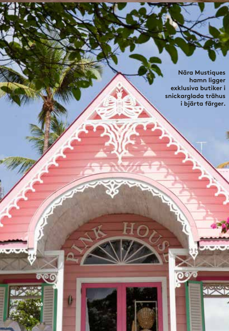
Nära Mustiques hamn ligger exklusiva butiker i snickarglada trähus i bjärta färger.

»Andra öar är vackra men Bequia är synonymt med paradiset«