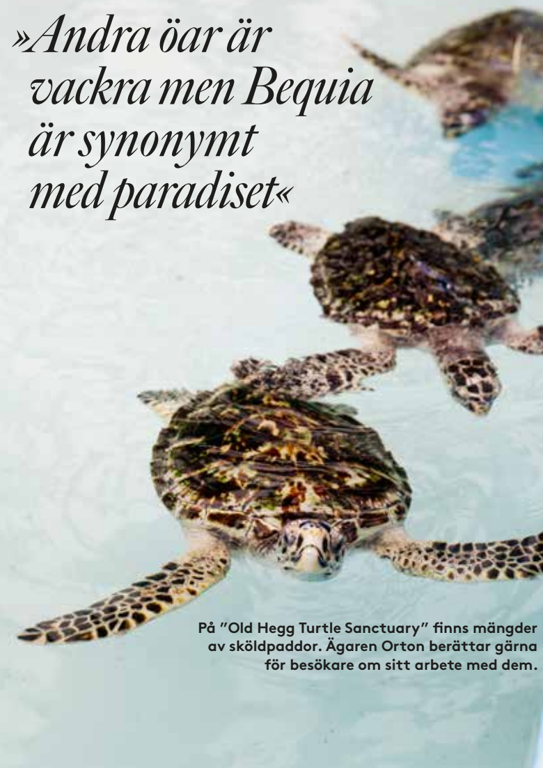
På "Old Hegg Turtle Sanctuary" finns mängder av sköldpaddor. Ägaren Orton berättar gärna för besökare om sitt arbete med dem.

»Andra öar är vackra men Bequia är synonymt med paradiset«