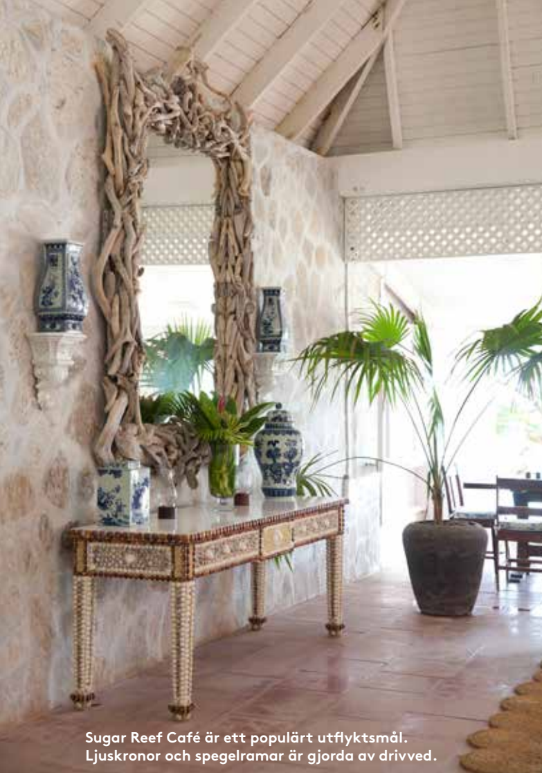
Sugar Reef Café är ett populärt utflyktsmål. Ljuskrönor och spegelramar är gjorda av drivved.