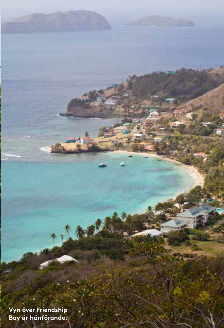
Vyn över Friendship Bay är häpningsvärd.